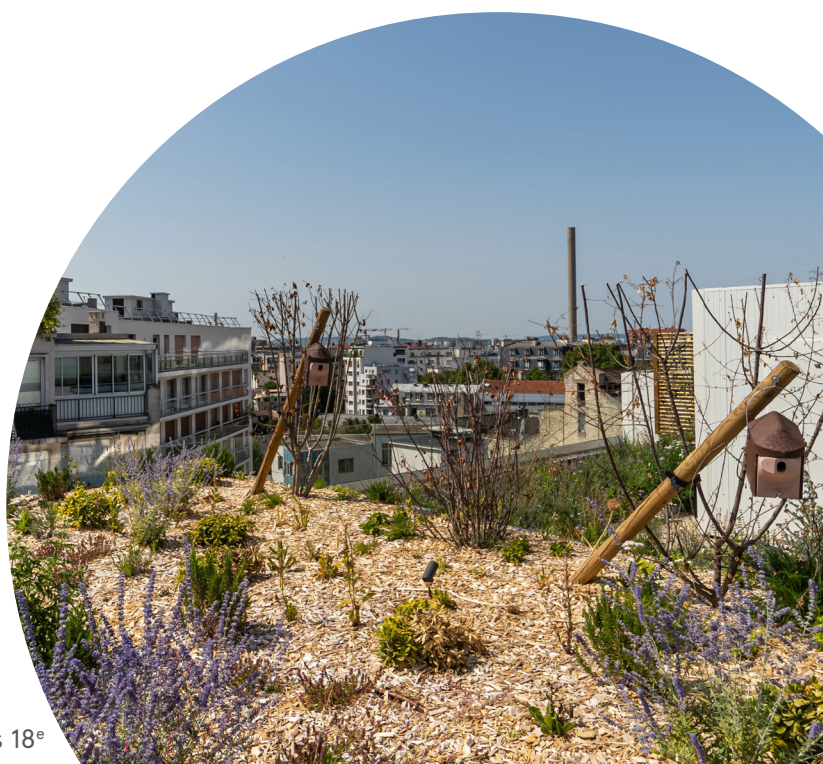
Gavroche, Paris 18 e