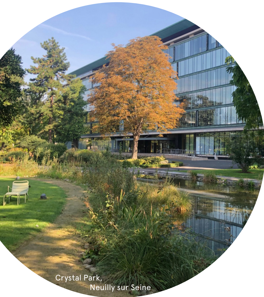
Crystal Park, Neuilly sur Seine