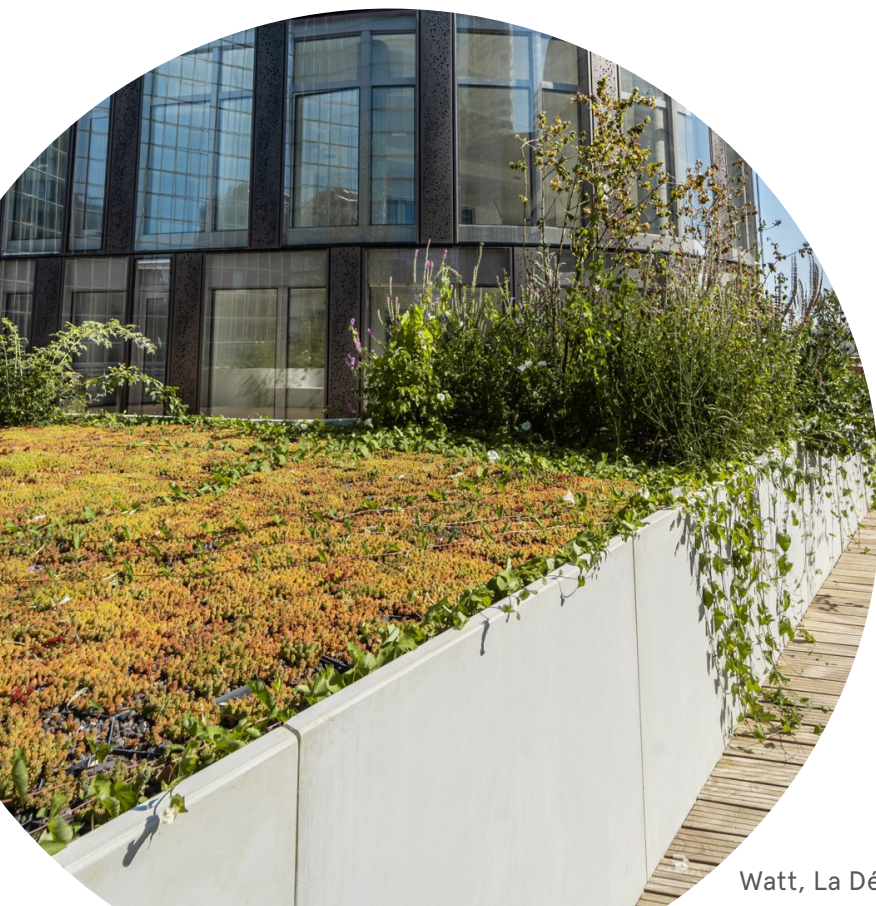
Watt, La Défense